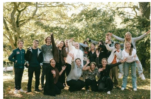
Färger med inspiration från den svenska naturen.